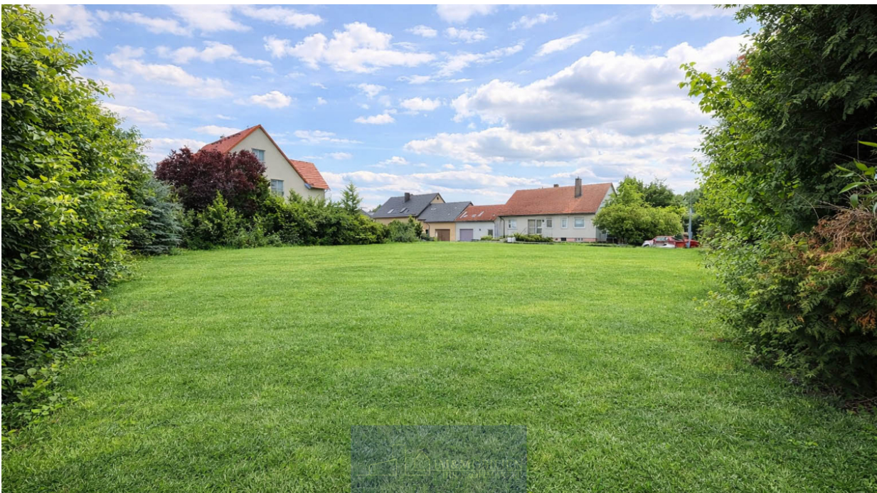
Grünes Grundstück in Vorstadtidylle