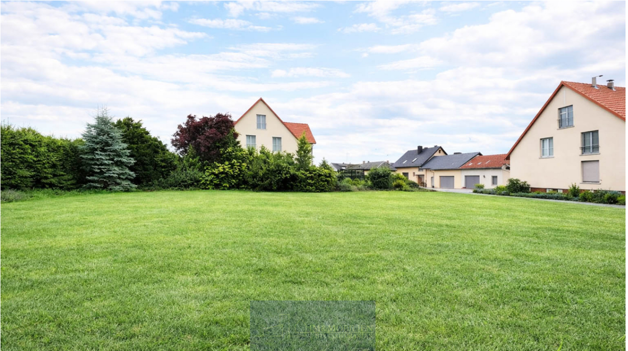
Grünes Grundstück zwischen Wohnhäusern